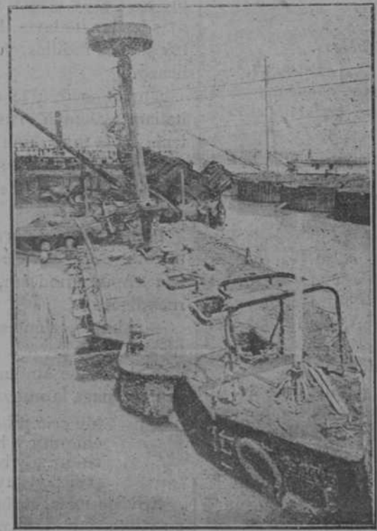
La superestructura del «Maine» en la bahía de la Habana, después del trabajo de las bombas.

Ha pasado cerca de esta costa, con rumbo á Casablanca, el transporte de guerra francés «Anatole».