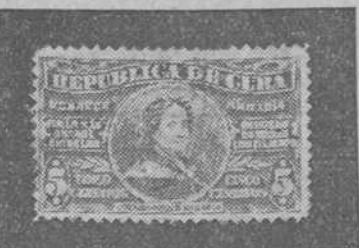
ERRORES... DE ERRORES