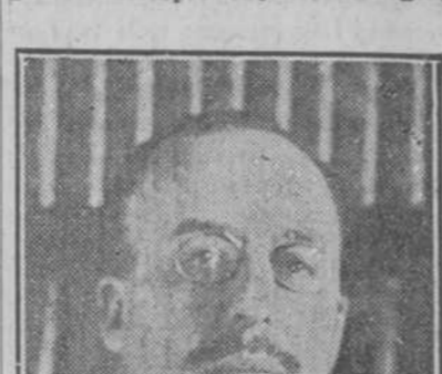
El ilustre polígrafo español don Carlos de Batlle