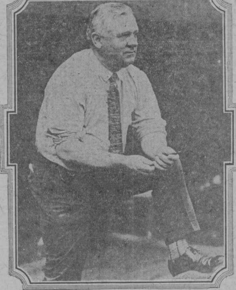
GANARA EL QUINTO PENNANT...? John McGraw, el famoso Pequeño Cabo, quien la temporada pasada trató de aumentar más su record, ganando el quinto pennant consecutivo en la Liga Nacional...

HA QUEDADO MAS FUERTE EN SU OFENSIVA EL TEAM CON BILLY TERRY