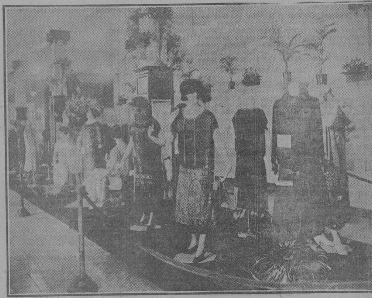
Artística plataforma en la que se ven parte de los bellísimos modelos de París que figuraron en la incomparable exposición de "El Encanto", ante la que desfiló toda la Habana, mereciendo las más justas y caudalosas alabanzas.