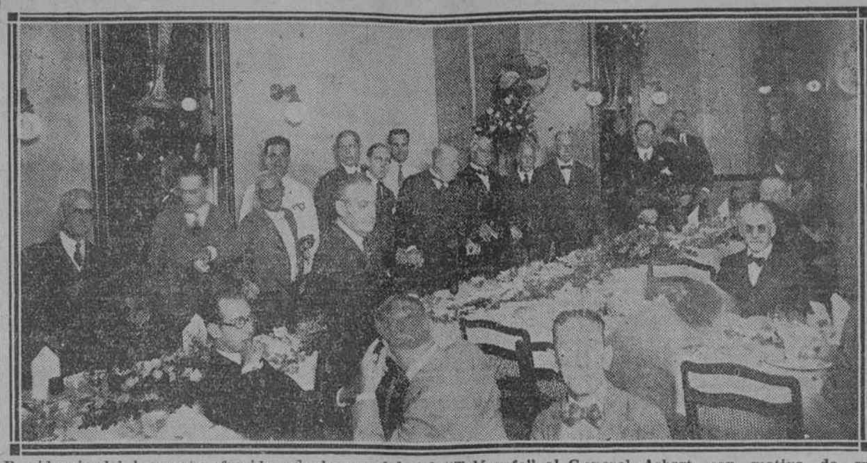
Presidencia del banquete ofrecido anoche en el hotel "Telégrafo" al General Asbert, con motivo de su onomástico, por amigos y simpatizantes.