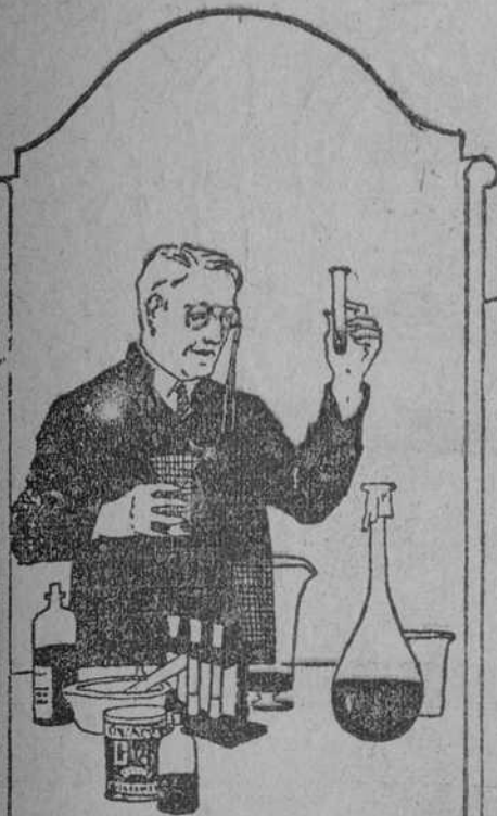
La ciencia ha descubierto el valor de Quaker Oats.