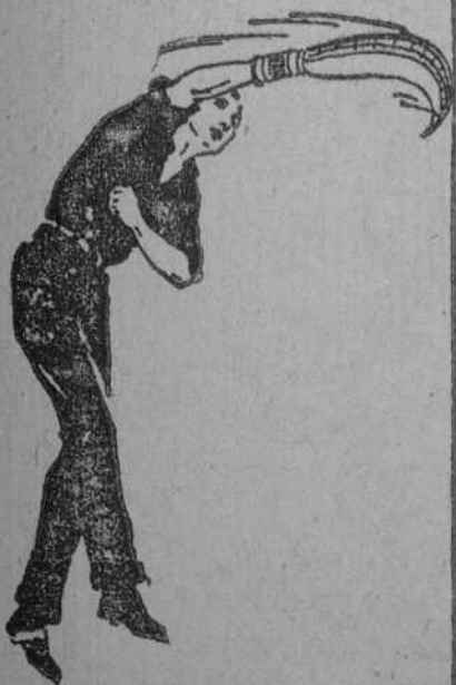
Los atletas de todo el mundo se entrenan a base de Quaker Oats.