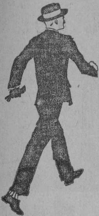
Quaker Oats suministra energías para una jornada de trabajo.