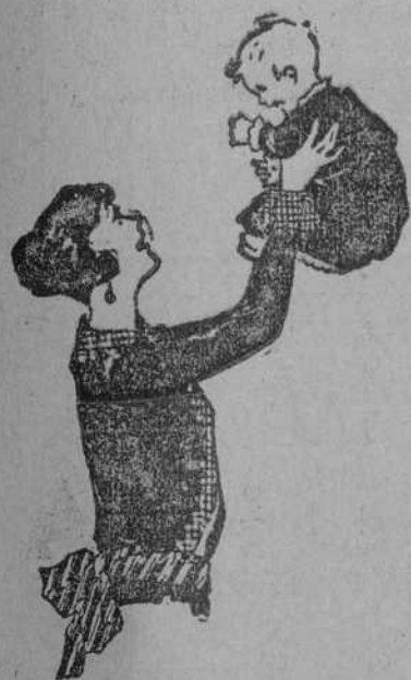
Nada hay mejor que Quaker Oats para el bebé o la mamá.