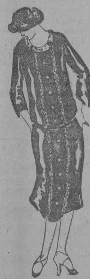
Gracioso modelito en tejido de lana color azul de Prusia; cuello de encaje y adorno de galón de seda multicolor; hilera de botones en elegante tonalidad "capucine".