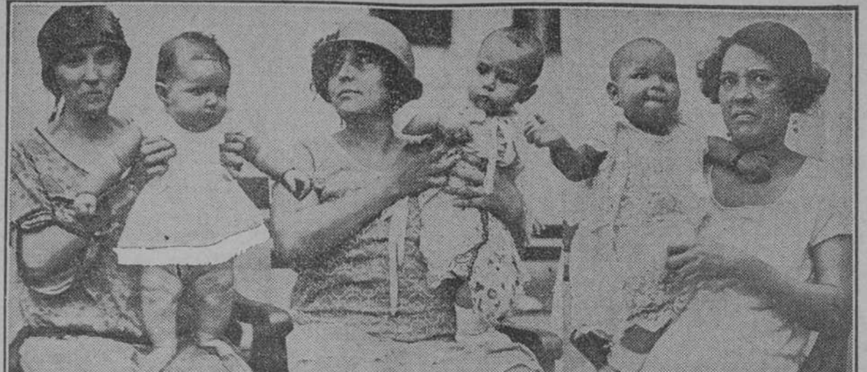
Los niños premiados en el Concurso local de la Maternidad...

SE EFECTUO AYER LA SELECCION DE LOS NIÑOS EN EL HOSPITAL MUNICIPAL