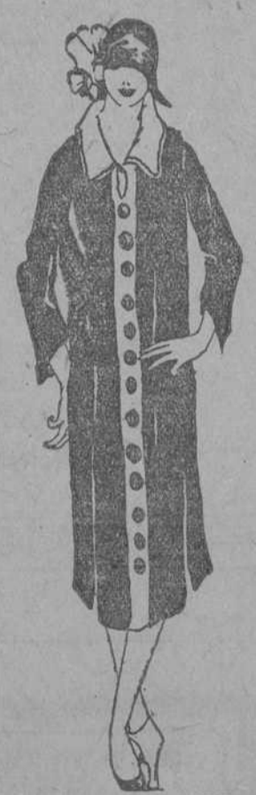
Elegante modelito en tejido de lana color tabaco; cuello y bis en el mismo material color "beige"; hilera de botones de fantasía.