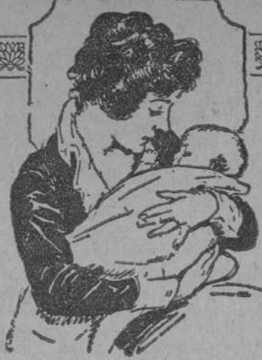
Más precioso que un ángel.

Los señores Ulloa y Co. han sido autorizados para marcar cuadros en el pavimento frente a su establecimiento, en Cárcel 19, para situar 10 o doce automóviles.