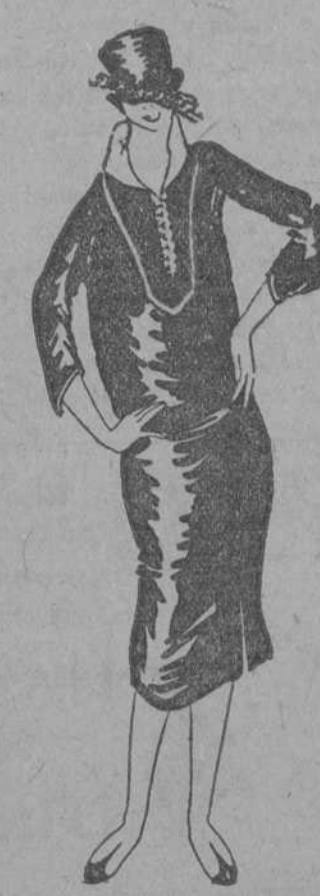
Muy vistoso modelito en género de lana color "beige-Patou"; el cuello, la terminación de las mangas y los bieses del frente están hechos con tejido de la misma clase en tonalidades contrastantes.