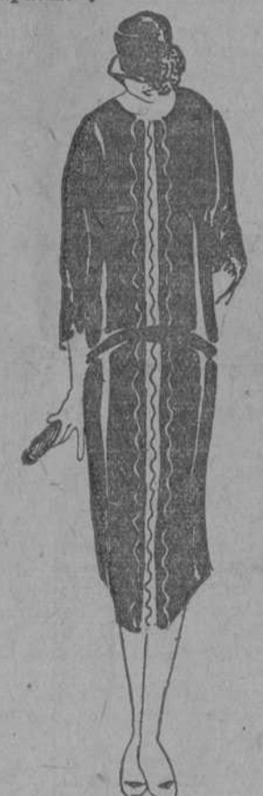
Otro modelito muy sencillo y elegante en tejido de lana negro; galón de piel color "beige" al frente; detalles de bordado a la cadeneta en blanco y negro.

Por medio de estas líneas y de la exhibición que hacemos en una de las vidrieras de-Aguila, brindamos hoy a nuestra clientela una de las más excepcionales ofertas de confecciones que jamás se hayan hecho. Vestidos de lana a $11.95. ¿No es esta, en verdad, una oferta tentadora? Debemos de hacer constar que se trata de prendas absolutamente dentro de la moda, de líneas sobrias y sencillas, del más alto grado de elegancia dentro del límite que se debe de suponer a mercancías de baratura tan extremada. No son vestidos que estamos liquidando: son vestidos provenientes de una de las tantas in-