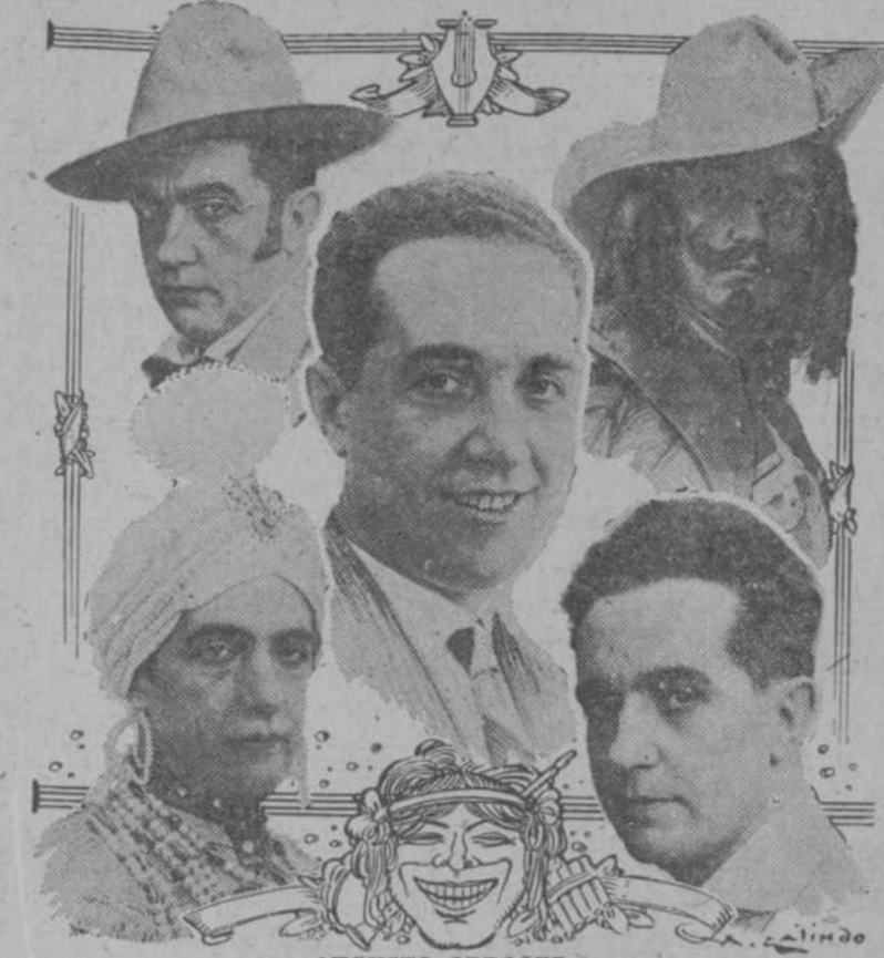
En los tipos que ha hecho famosos en la actual temporada...