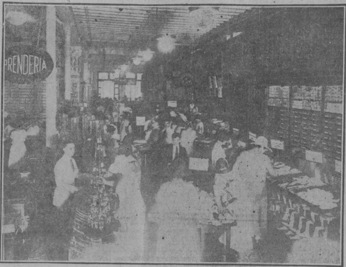
Vista parcial de uno de los salones de EL ENCANTO, que está siendo visitadísimo estos días con motivo de la gran venta titulada "Post-Balance".