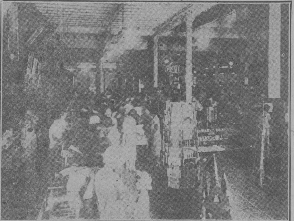
Otro aspecto interior de EL ENCANTO en plena actividad comercial. En primer término se ve el Departamento de Modas y Patronos MGS CALL, atendido por bellas y amables señoritas.

Nuestro redactor gráfico señor Buendía pudo obtener, en momentos de relativa calma, los dos aspectos que de aquellos almacenes ofrecemos aquí a los lectores del DIARIO DE LA MARINA.