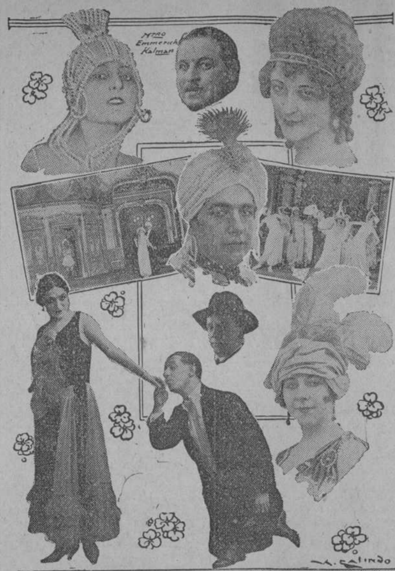
El maestro EMMERICH KALMAN, recibirá mañana un significativo tributo de admiración, en la vigésima quinta representación de su famosa obra "LA BAYADERA"...

LA FUNCIÓN ES CORRIDA, comienza a las ocho y cincuenta y cinco y los precios de las localidades han sido fijados a base de: $1.50, LA LUNETA 24-17