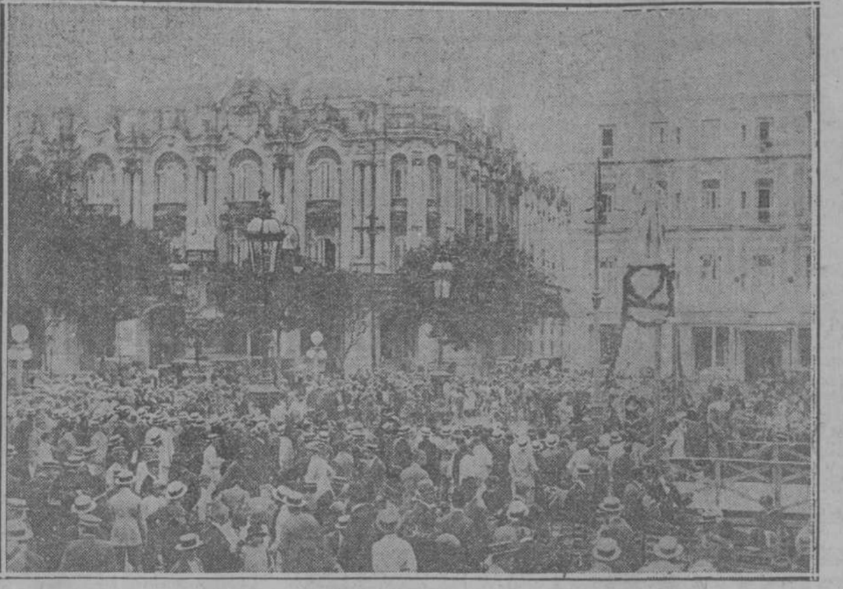
La concurrencia ante la estatua del Apóstol

A CAUSA DEL MAL TIEMPO REINANTE, HUBO NECESIDAD DE APLAZAR PARA OTRA FECHA, QUE YA SE DETERMINARA OPORTUNAMENTE, ALGUNOS DE LOS ACTOS PROYECTADOS