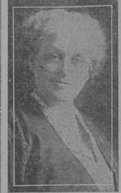
Mrs. Carrie Chapman Catt, Presidenta de la Unión Internacional de Mujeres Sufragistas, que llegará hoy procedente de Nueva York.

Esta noche, y en la Academia de Ciencias, se celebrará una fiesta para presentar a la presidenta de la Liga Internacional del Sufragio, Mrs. Carrie Chapman Catt, que llegará hoy en el vapor "Siboney", en