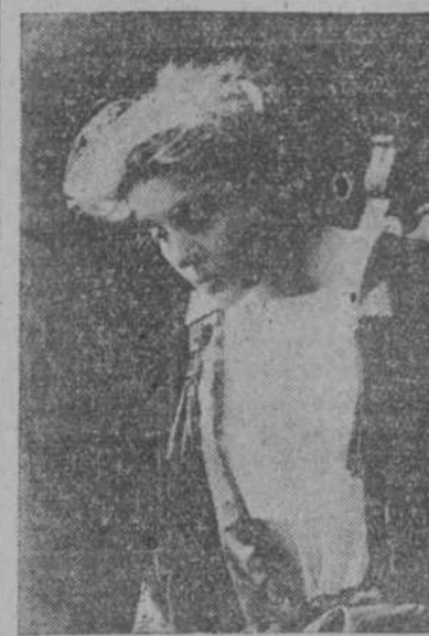
Eleonora Duse, la genial trágica italiana que a fines del presente mes actuará, con su compañía, en el Teatro Nacional.

Al anuncio de que en breve actuará en nuestro primer cine la gran artista italiana que pudo asombrar al mundo con su arte maravilloso, los miembros de la belleza y de la emoción se han entusiasmado.