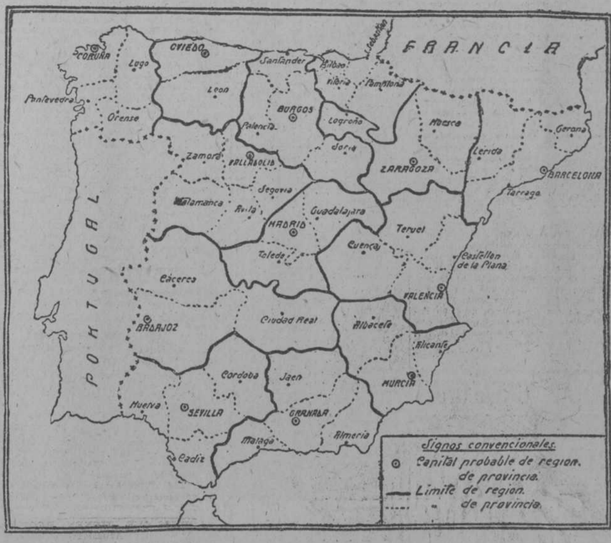
EL ANTERIOR GRAFICO DE UNA POSIBLE ORGANIZACION REGIONAL DE ESPAÑA

De nuestra Redacción en Madrid Por el DR. L. FRAU MARSAI