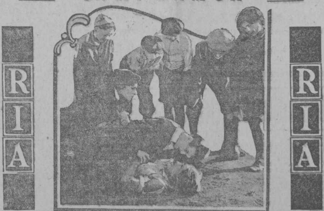
Scene from "RAGS TO RICHES" featuring WESLEY BARRY WARNER BROS. PICTURE