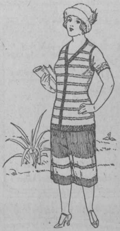
Trajecito de estambre y seda, tipo sport (la saya sultán), sin mangas, en cualquier color que usted desee; hay muchísimos. A $13.65.