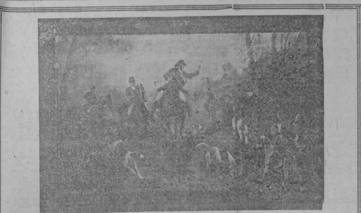
"LA CAZA DEL CIERVO"

Colonia Imperial Guerlain, etiqueta blanca, $4.00 el litro y $2.70 el medio litro. Colonia Guerlain, etiqueta azul, $5.00 el litro y $3.00 el medio litro. Loción Guerlain, perfumes surtidos, a $1.00. Cajas jabón Guerlain, papel blanco, $0.70, papel azul, $0.90; papel rosado $1.30. Loción Eramis, perfumes surtidos, a $1.40. Mojo vegetal de Dorin, estuche tafleté, $0.75; estuche piel, $0.50. "LA ESMERALDA" SAN RAFAEL No. 1. TELEFONO A-3303 (ENTRE CONSULADO E INDUSTRIA)