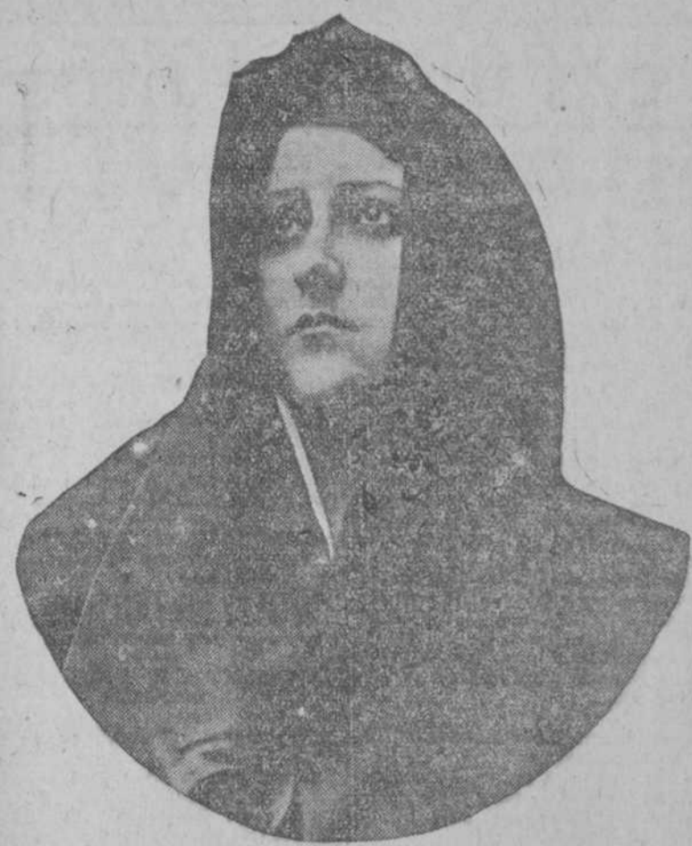
OFELIA NIETO Ilustre cantante española que reaparecerá mañana con "Aida".

Ya se encuentran en la Habana todos los artistas que han de tomar parte en la temporada oficial de ópera.