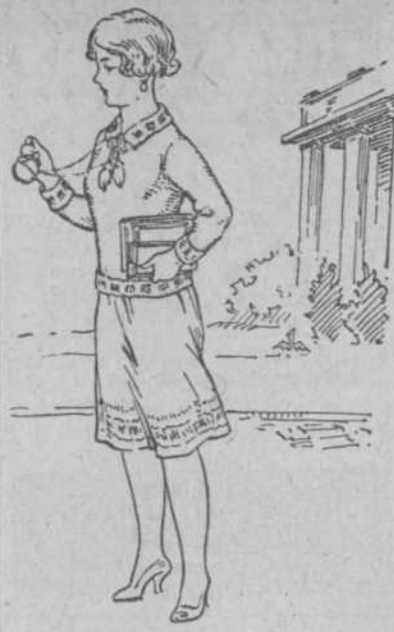
prenda; los otros a los dibujos que le adornan. A $5.40.

La descripción de un surtido de artículos de estambre como el que ofrecemos hoy es, ardua tarea rayana en lo imposible. Contando, pues, con su amable visita, quede, aquí, ociosa nuestra pluma: deje paso al lápiz minucioso de Monsieur Bierig que nos presente, a guisa de muestra, tres "tipos" elegidos al azar entre el surtido abrumador que es nuestro orgullo. Porque es, sencillamente, inmejorable!