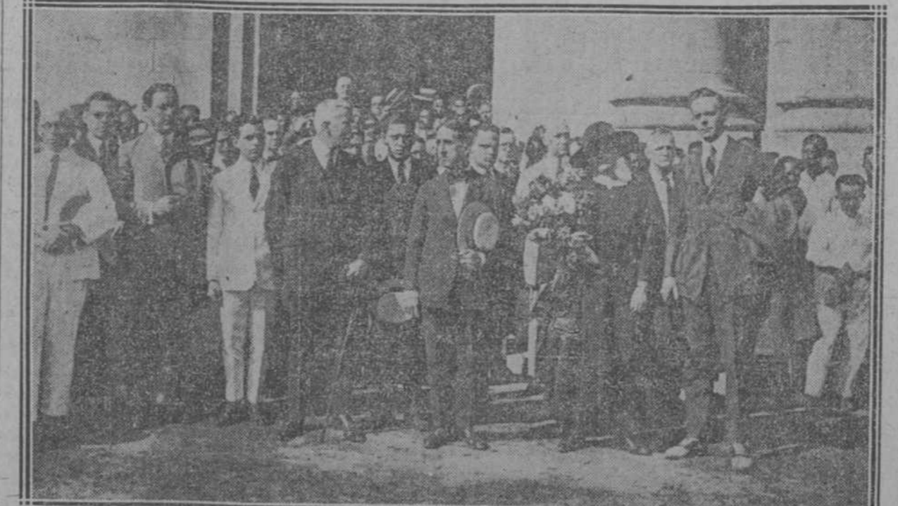
Homenaje a los americanos caídos en San Juan durante la guerra hispanoamericana. Momentos de desembarco en el muelle de la Aduana de Santiago de Cuba...

DISTINTAS REPRESENTACIONES DE TODAS LAS CLASES SOCIALES ESTUVIERON PRESENTES CUANDO LOS COMISIONADOS LLEGARON A LA ESTACION, HACIENDOLES OBJETO DE GRANDES AGASAJOS, QUE LOS VISITANTES AGRADECIERON MUCHO