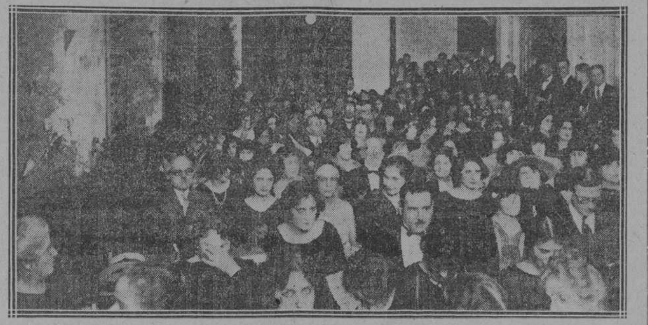
Apertura del Salón de Humoristas. — Aspecto de la Concurrencia.