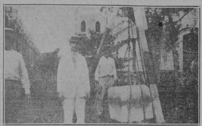
La piedra que se colocó el día 22 de Octubre en el lugar donde va levantarse el pabellón de cirugía, en el Sanatorio de la Colonia Española.