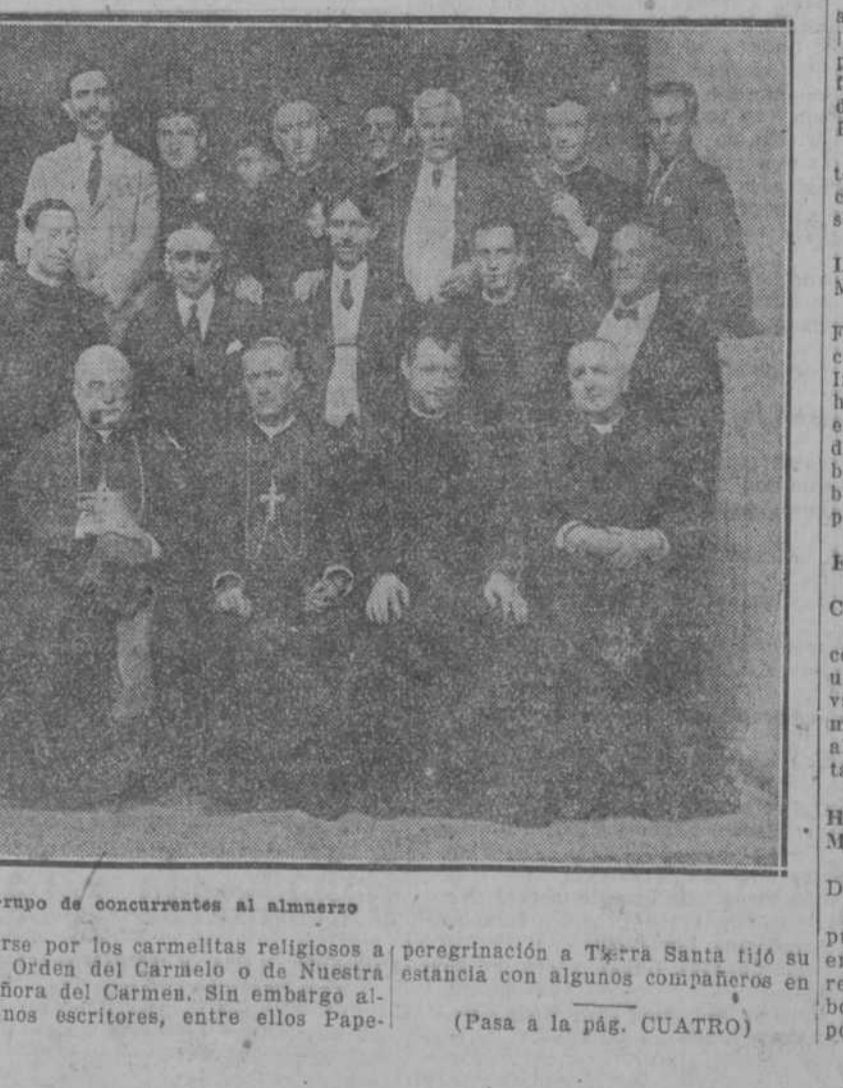
Grupo de concurrentes al almuerzo

Diré, además, que en distintas ocasiones le brindé a usted mis modestos oficios cerca del señor Alcalde para convencerlo del error en que está, sosteniendo un decreto muy bien inspirado, sin duda alguna, pero con defectos legales que lo invalidan.