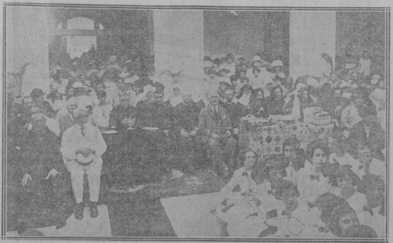
Aspecto que presentaba el salón de actos del Colegio Teresiano, durante la repartición de premios que presidió el Obispo Diocesano.

Conforme habíamos anunciado en el lugar aver la distribución de premios del gran Colegio Teresiano para señoritas, que se levanta en la calle 12 y 17 en la aristocrática barriada del Vedado.