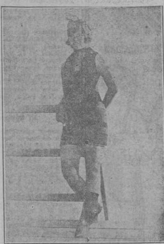
No. 1956 Traje de baño, de lana, con pantalón interior unido. Como puede verse en el grabado, es corto y ceñido al cuerpo.