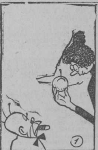
—Vd. será el juez. De la manzana a las más bella.