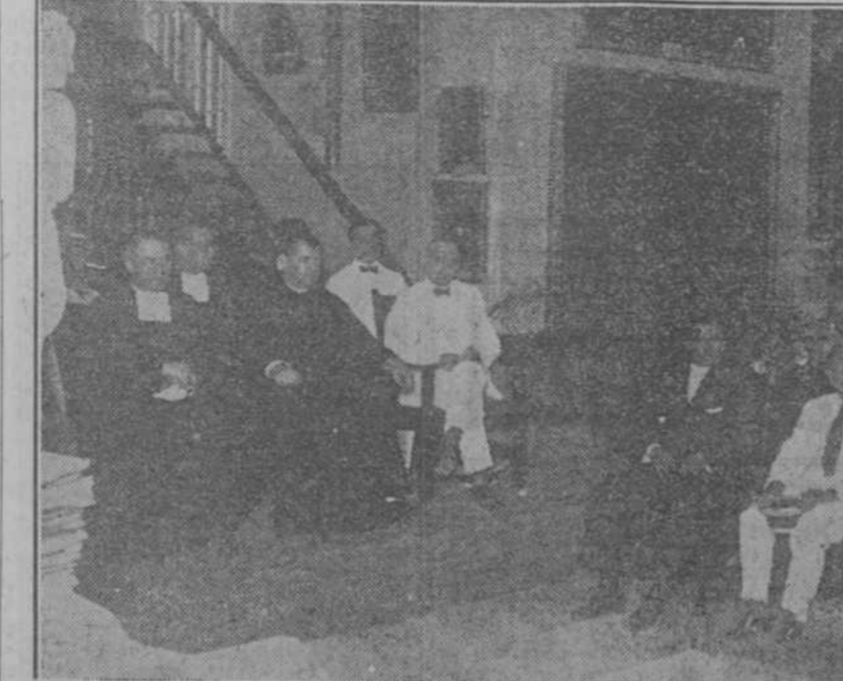
UN ASPECTO DE LA CONCURRENCIA.