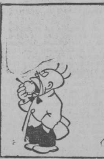
—La mejor es que yo me coma la manzana.