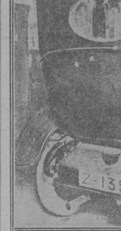
Estado en que quedó el automóvil que ocupaba el arzobispo de Zaragoza después del atentado de que éste fue víctima. Pueden contarse en el coche perfectamente hasta diez Impactos.

Durante la pasada noche velaron el cadáver del cardenal Soldevilla en la capilla ardiente de la catedral de Zaragoza.