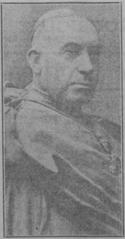
El cardenal D. Juan Soldevilla y Romero, arzobispo de Zaragoza, asesinado el día 4 del actual