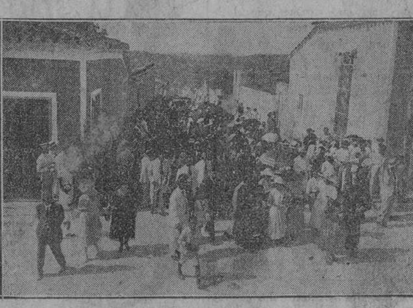
Los peregrinos dirigiéndose al templo.

Ayer se efectuó la Excursión Eucarística de los señores banqueros al pueblo de Jaruco. Fué organizada por las Marías del Sagrario constituyendo un magnífico triunfo, que imperecedero recordando la dicha de tomar parte en la misma, así como en el pueblo de Jaruco, el cual noble y hospitalario recibió con gran entusiasmo a los católicos de la Habana.