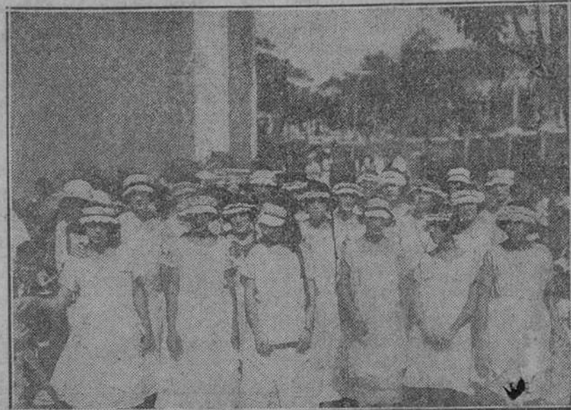
Señoritas de Jaruco que sirvieron el desayuno a los excursionistas.