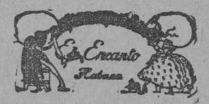
REGALOS DE BODA. El más completo y variado surtido, lo mismo en joyas, que en objetos de arte.

Son modelos de Chanel, de Patou y de otras acreditadas casas. Mañana daremos interesantes detalles de estos exquisitos vestidos de noche.