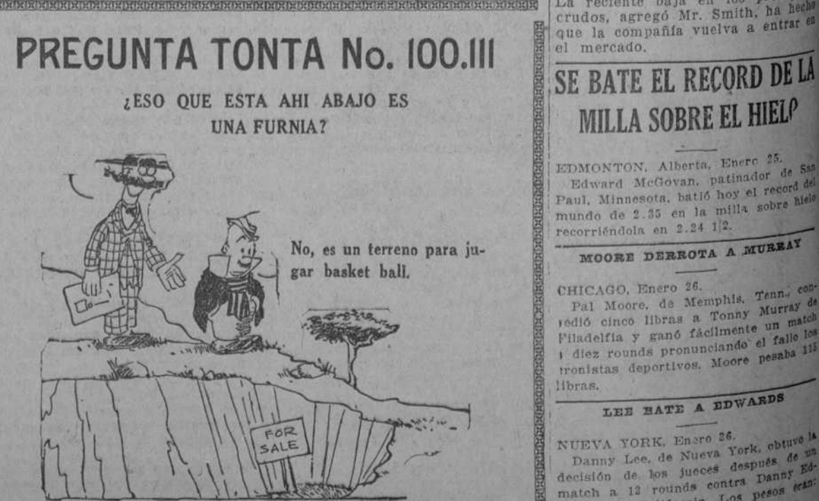
No, es un terreno para jugar basket ball.