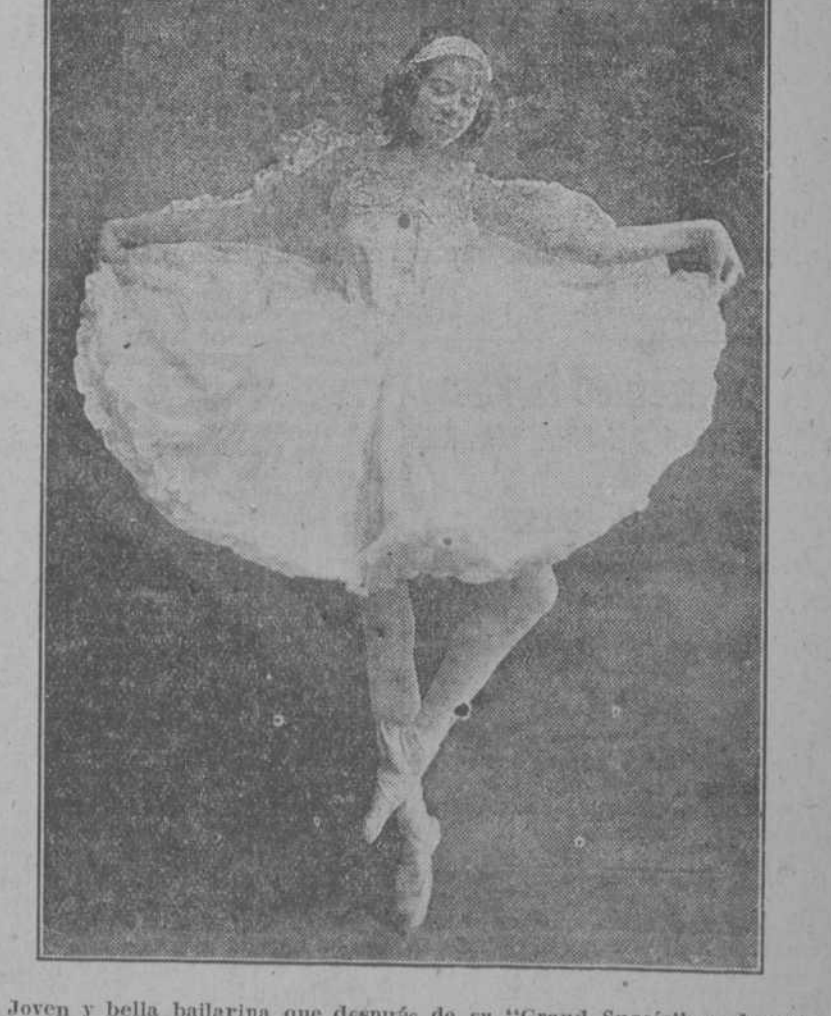
Joven y bella bailarina que después de su "Grand Succés" en la primera noche americana del "Plaza" seguirá presentándose todos los miércoles en la fiesta semanal del elegante hotel.