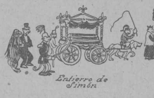
Entierro de Simón