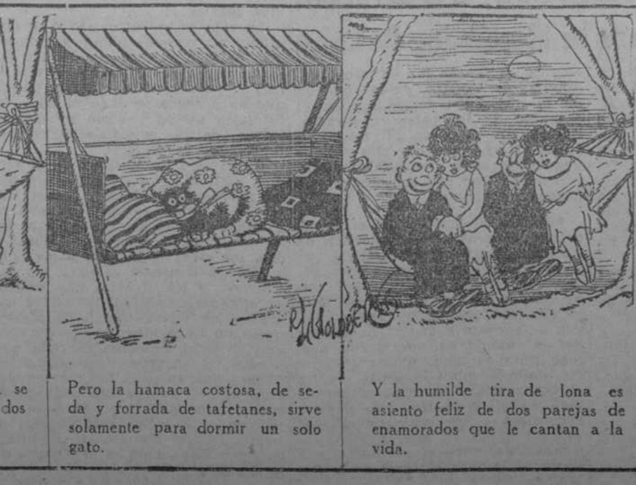
Mientras esta tira de lona se mece por la brisa colgada de dos pequeños árboles. Pero la hamaca costosa, de seda y forrada de tafetanes, sirve solamente para dormir un solo gato.