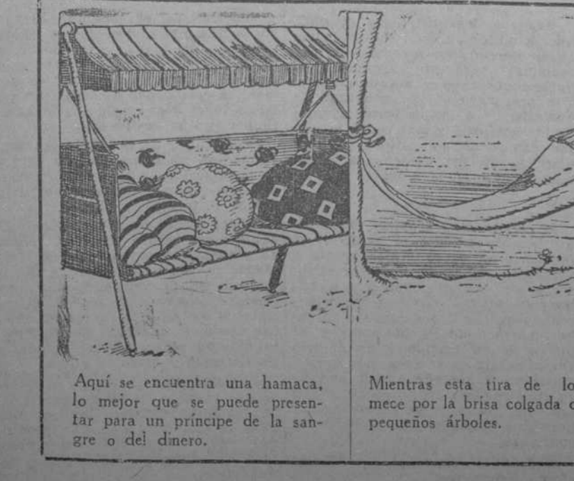
Aquí se encuentra una hamaca, lo mejor que se puede presentar para un príncipe de la sangre o del dinero.