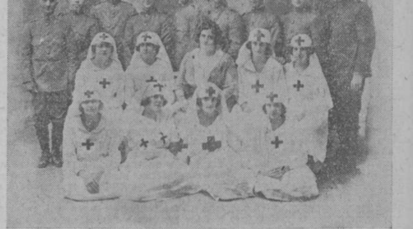
Scorritas y jóvenes de Gibara que el "Día de la Raza" cantaron en carácter la canción del soldado.

Fragmento de una carta que firma "Un suscriptor": "Está Ud. un poco haragán; ya no nos describe los combates como aquellos de Mura Tahar del año pasado, ni como las descripciones del principio de esta guerra. Yo conservo los recortes..."