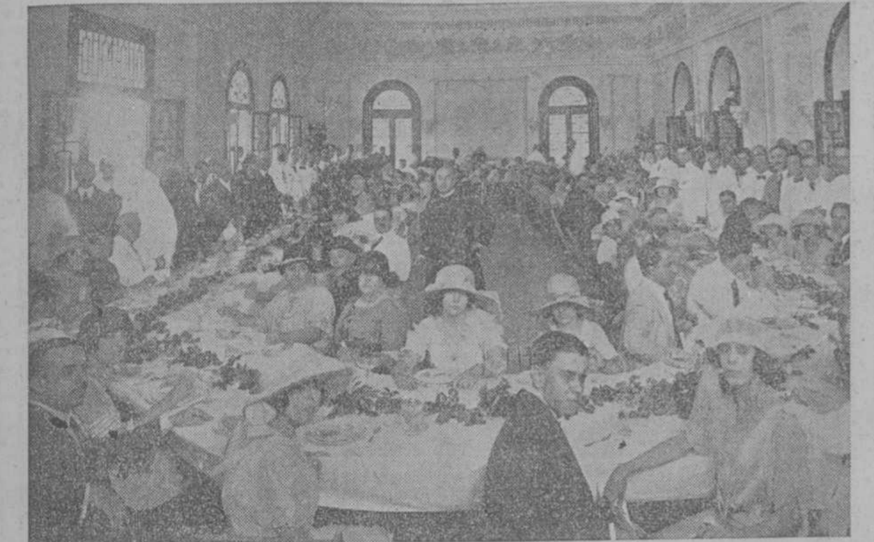
UN ASPECTO DE LA FIESTA CELEBRADA AYER, EN "LA COVADONGA."