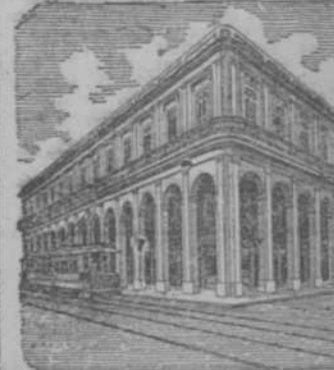
HOTEL GLORIA CUBANA. MANSERRE, S. A. Teléfono A-5022. Hospedaje Especial para las Familias, etc.

SE ALQUILA UN PISO EN SAN RAFAEL Y MARQUES GONZALEZ, con 4 habitaciones, sala, sala, comedor, baño, cocina de gas y todos los servicios. Informan: San Miguel, 211. 11 my. 17850