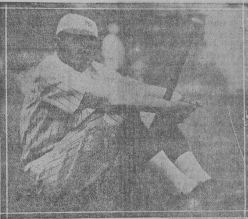
EL REY DEL BATE.—Babe Ruth, el campo izquierdo del club de base ball neoyorking de la Liga Americana (Yankees) que ha batido hasta ahora su propio record de home runs establecido en 1920.