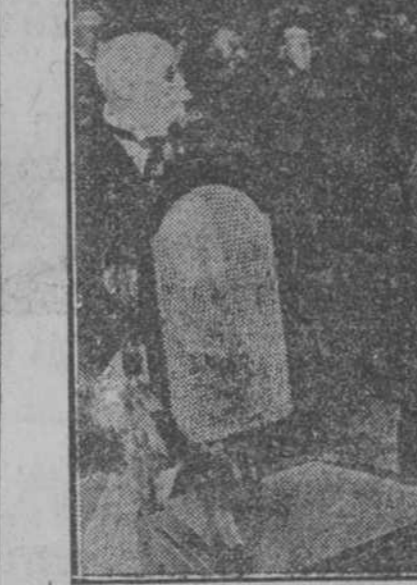
La presidencia de la velada científica celebrada anoche en el Colegio de Belén.