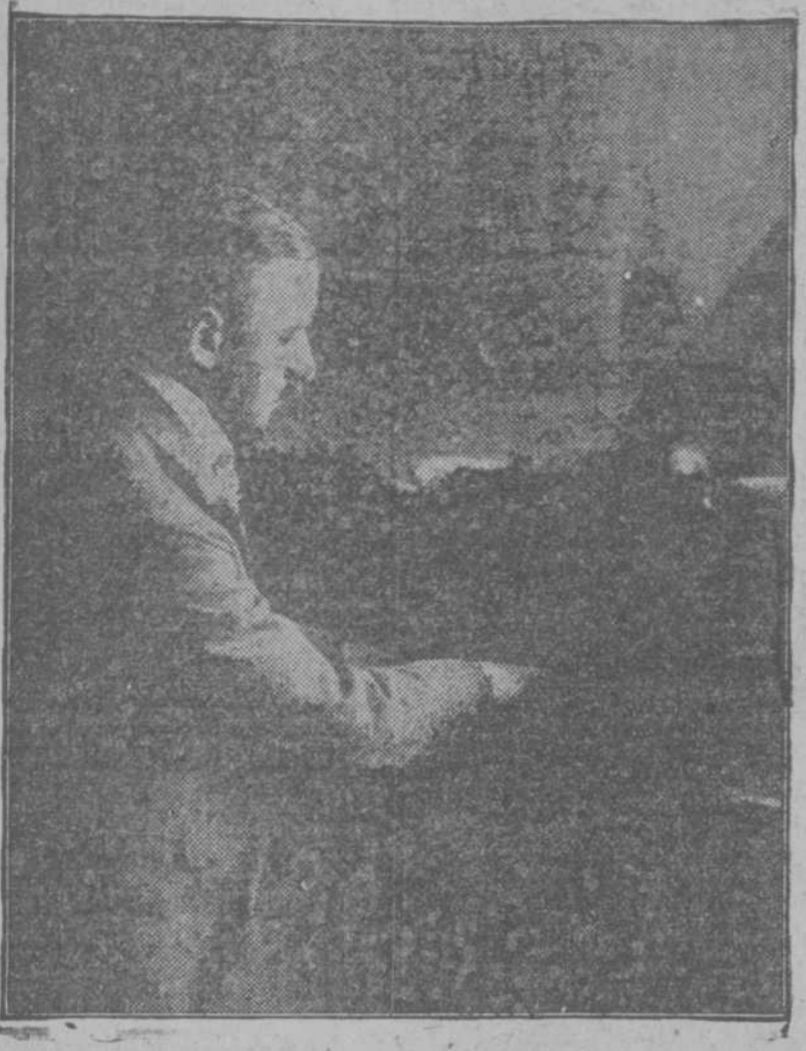
RUDOLPH GANZ. Célebre pianista contratado por la So. ciudad Pro Arte Musical, que ofrecerá tres conciertos en el Nacional.