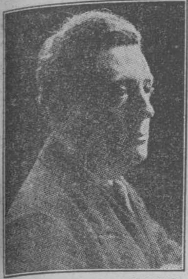
EL GENIAL ACTOR DRAMÁTICO FRANCISCO MORANO