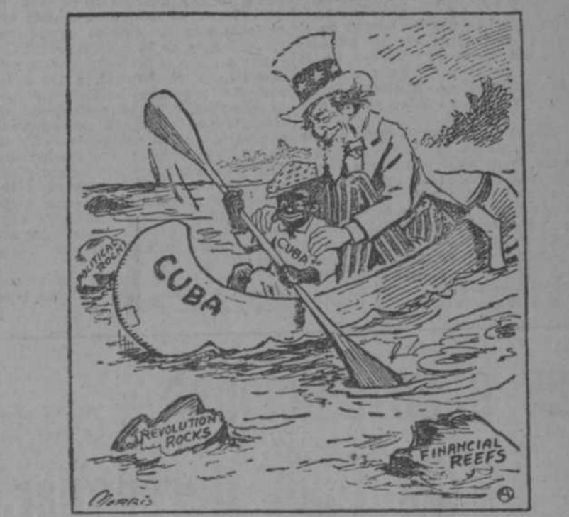
ATUNANDO A REMAR EN PROPIA CAUSA

La Agencia Adam tiene formado de Hispano-América un concepto desastroso. El progreso yanqui, libre de sombras y de maculadas, alboró en horas de bienestar y ventura. Extensión por los hemisferios y fué de un otro polo cantando las sinfonías del amor, de la gloria y del triunfo. Salieron de sus madrigueras los indios cuando los españoles pusieron su planta en las tierras que hoy los yanquis desean controlar, aunque en ellas no haya pájaros financieros. La barbarie de los primitivos pobladores—esto no lo decimos nosotros—subsistió a través de los siglos y aumentó, aumentó con la abundancia de negros que fué el infame negocio a que se dedicaron los colonizadores. ¿Qué me dices, Voltaire?... Los negros de Hispano América son libres, y los de este país arrastran unas cadenas muy pesadas y sólo pueden ganar el pan trabajando en las canteras y mchacando gravas, y a fin de cuentas, acaban su vida quemados en pira o ahogados de un árbol. Los negros de este país no han llegado aún a ser superiores al perro, y si, por desgracia, matasen al peludo sabido por la dama millonaria arrastrando sus cadenas por las turbas infuercidas hasta que todos sucumbiesen a golpe de machete. Lincoln intentó salvarlos. Pero desde el gran Presidente acá continúa funcionando el pintoresco linchamiento, y los yanquis—ellos no se atreverían a negarlo—estiman más a un oso de sus parques—a los que dan cacahuetes—que a los quince millones de negros norteamericanos. Continúa en la ULTIMA página