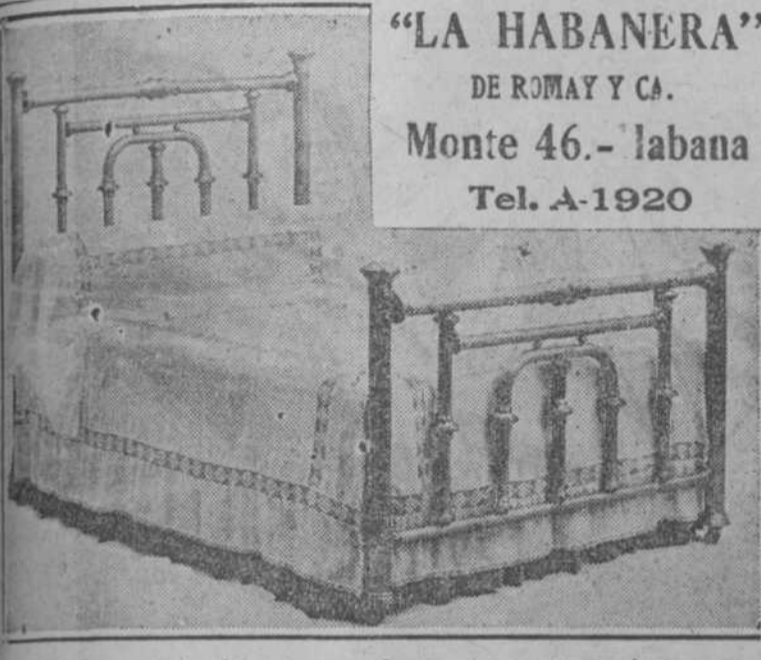
“LA HABANERA” DE ROMAY Y CA. Monte 46.—labana Tel. A-1920