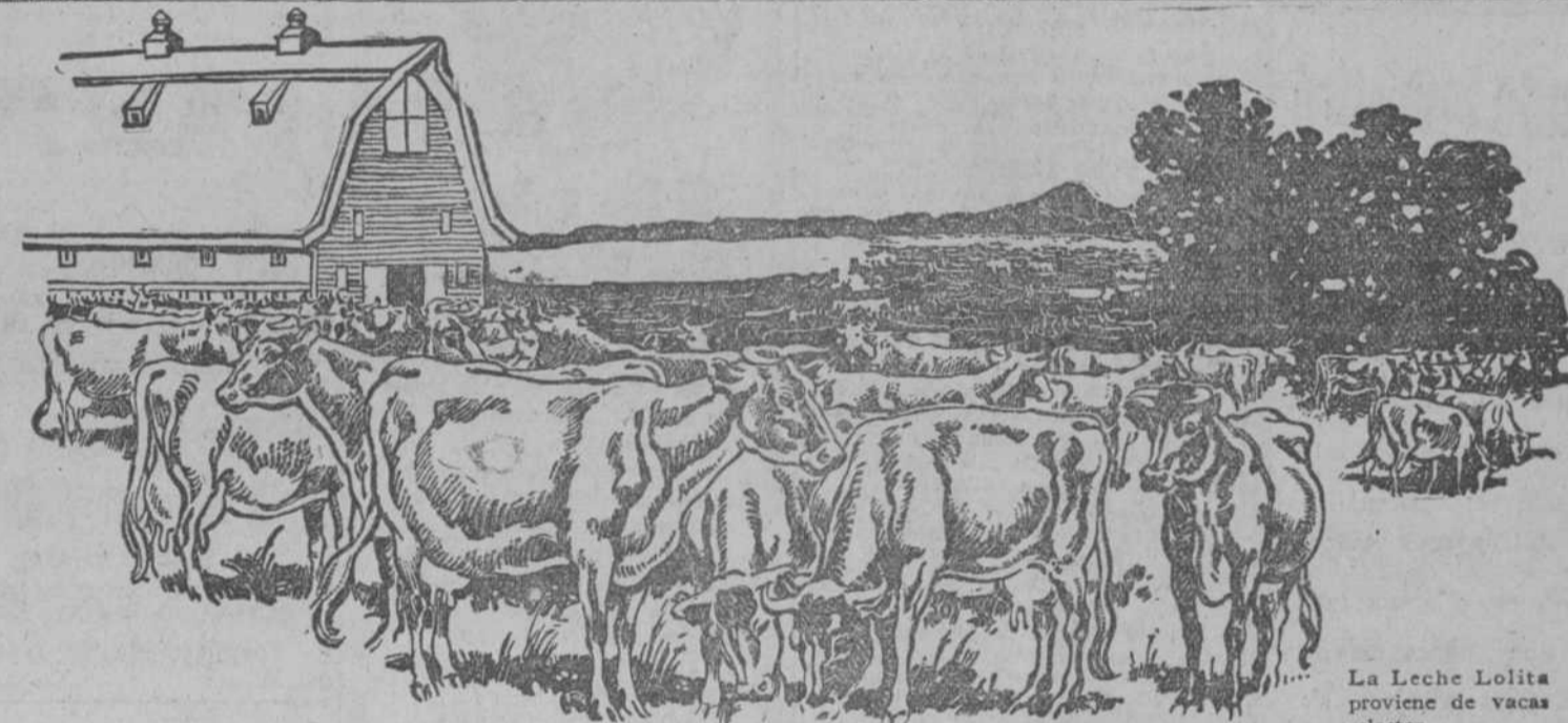
La Leche Lolita proviene de vacas selectas.

Contiene doble substancia que la leche embotellada