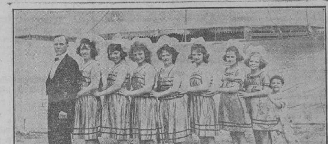
Los siete pequeños Nelsones de la familia de los Santos y Artigas.

Esta familia constituirá una de las principales atracciones del Circo Santos y Artigas. Siete señoritas y dos caballeros tomarán parte en admirables actos acrobáticos, equilibristas, icarios, etc. etc., que podrán presenciarse en el teatro Payret la noche del 12 de Noviembre.