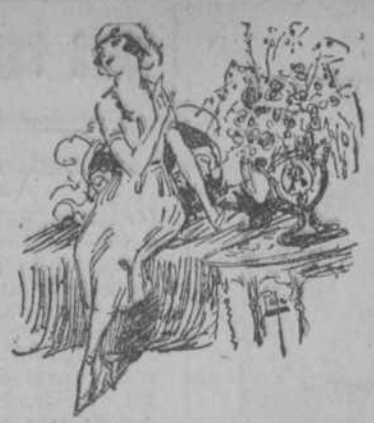
—La tienda ideal—dijo una elegante señora—es la que lo tiene todo. Por eso yo compro siempre en El Encanto.

El DIARIO DE LA MARINA lo encuentra Ud. en todas las poblaciones de la República.