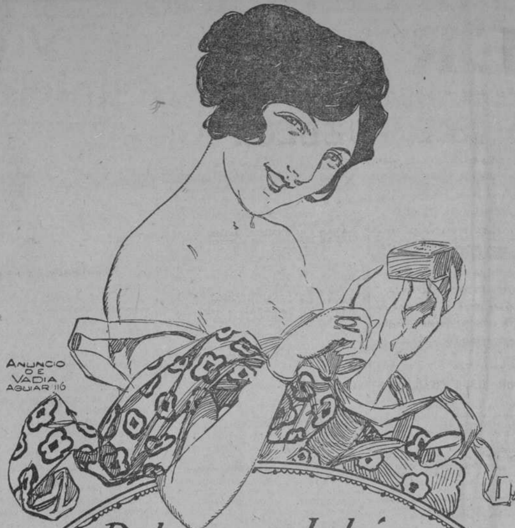
ANUNCO DE VADIA AGUAR 110

Las autoridades médicas indican con toda claridad las disposiciones que deberán tomarse para detener esta horrible, lenta y de otro modo inevitable matanza de todos los niños de una ciudad de dos millones y medio de habitantes. Habrá de importarse inmediatamente leche fresca y con leche en cantidades suficientes, manzanas, limones y naranjas, mediante los cuales se pueda contener el desarrollo del escorbuto infantil; habrá de enviarse a Viena algunas sustancias medicinas, como aceite de palma, de oliva y de hígado de bacalao, para auxiliar a los médicos a combatir el raquitismo. Debería procurarse grandes cantidades de lienzo para proteger a los niños de pecho y pañuelos, de prendas de vestir y ropa interior de lana para todos los niños y jóvenes, con el fin de preservarles contra los padecimientos de la laringe y de los pulmones, a que están expuestos todos por la falta de protección contra el frío, la lluvia y la nieve. Finalmente, debería encontrarse caminos y modos de proveer rápidamente a Viena todo el carbón