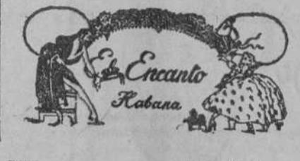
C455 1t-9 Id.-9

Nuestro maestro cortador ejecutará su orden a su entera satisfacción, y usted podrá usar unas hermosas camisas que, además de pregonar su buen gusto, respondan, en su confección y en sus detalles, a su personal criterio. En corbatas, como en los demás artículos, tenemos las últimas novedades. ¡Sería tan interesante para usted, y tan agradable para nosotros, una visita a nuestro Departamento de caballeros!