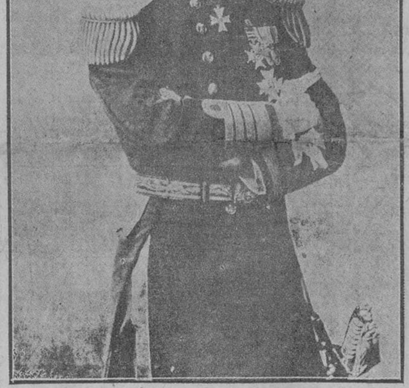
DE LA FIRMA DEL TRATADO A SU RATIFICACION