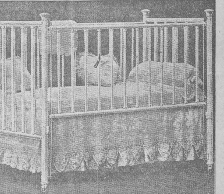
"EL ANGEL DE CUBA". DE ROMAY Y COMPANIA MONTE 46 TELEFONO A-1920. CAMAS DE TODAS CLASES.—Juegos de cuartos, ídem de mimbres, crotacas y de comedor, lámparas, cuadros objetos de arte, etc. AL CON-TADO Y A PLAZOS.

GIROS POSTALES Se ha ordenado que el servicio de "Giros Postales" se establezca en la Administración de Correos del "Central Hershey", provincia de la Habana, cuya inauguración tendrá efecto el día 10 de octubre del año en curso.