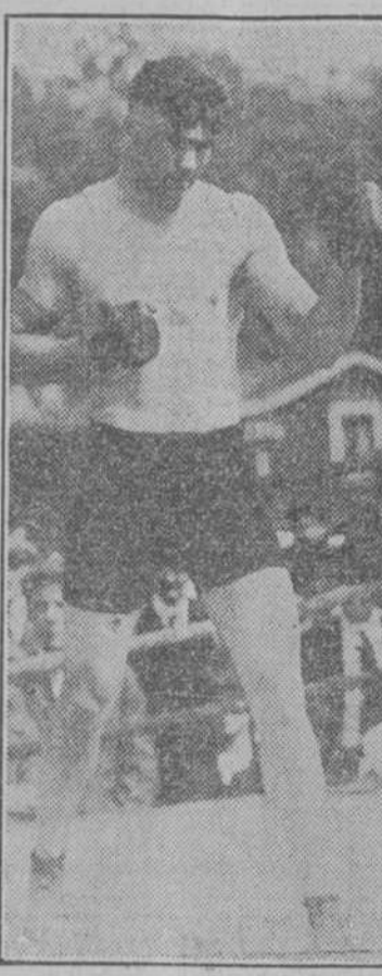
Jack Dempsey, el luchador del Estado de Colorado, hoy campeón mundial, que dentro de seis meses retará al mundo entero.

EL PERSONAL VETERINARIO DEL EJERCITO Para poder aumentar el servicio personal veterinario del Ejército, la Ley Orgánica de las Fuerzas Armadas.