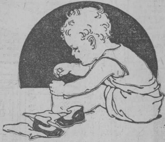
EL VERANO INTENSIFICA LAS DIFICULTADES PARA ALIMENTAR A LOS NIÑOS.

Artículo XXIII.—Serán de la competencia de los Juzgados Correccionales los delitos y faltas señaladas por los artículos número 4, caso tercero y sexto, en relación con el artículo cuarto, caso tercero;