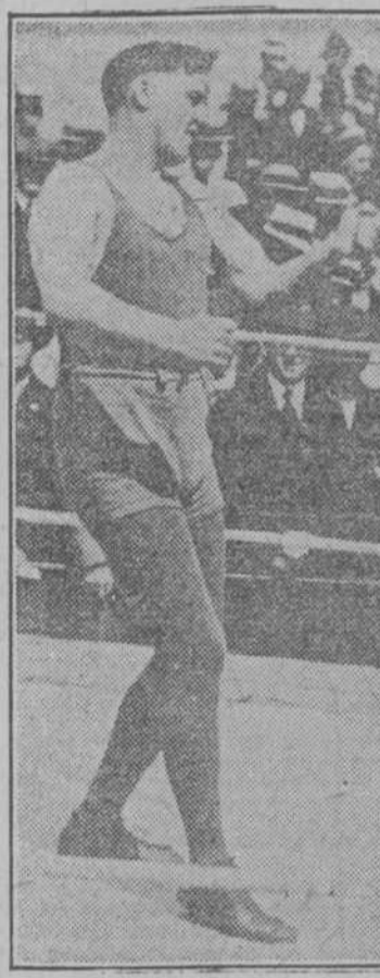
La prensa de los EE. UU. está indignada contra el ex-campeón Jess Willard por la mala preparación demostrada en su lucha con Jack Dempsey.

TORRENTAS EN ESPAÑA Madrid, 9. De la mayoría de las provincias se reciben noticias acerca de los grandes daños causados en las cosechas pendientes de recolección, en los viñedos y en los frutales, por las tormentas de granizo que han descargado.