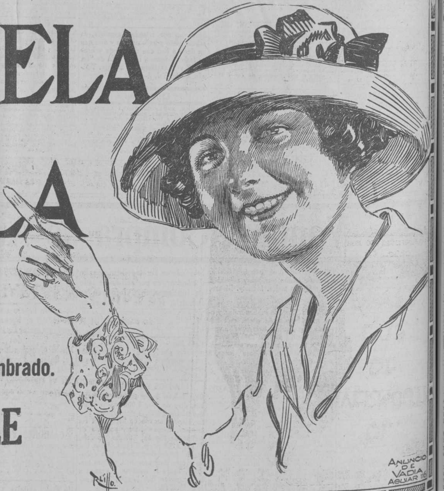
ANUNCIO DE VADIA ASLVAR 1919