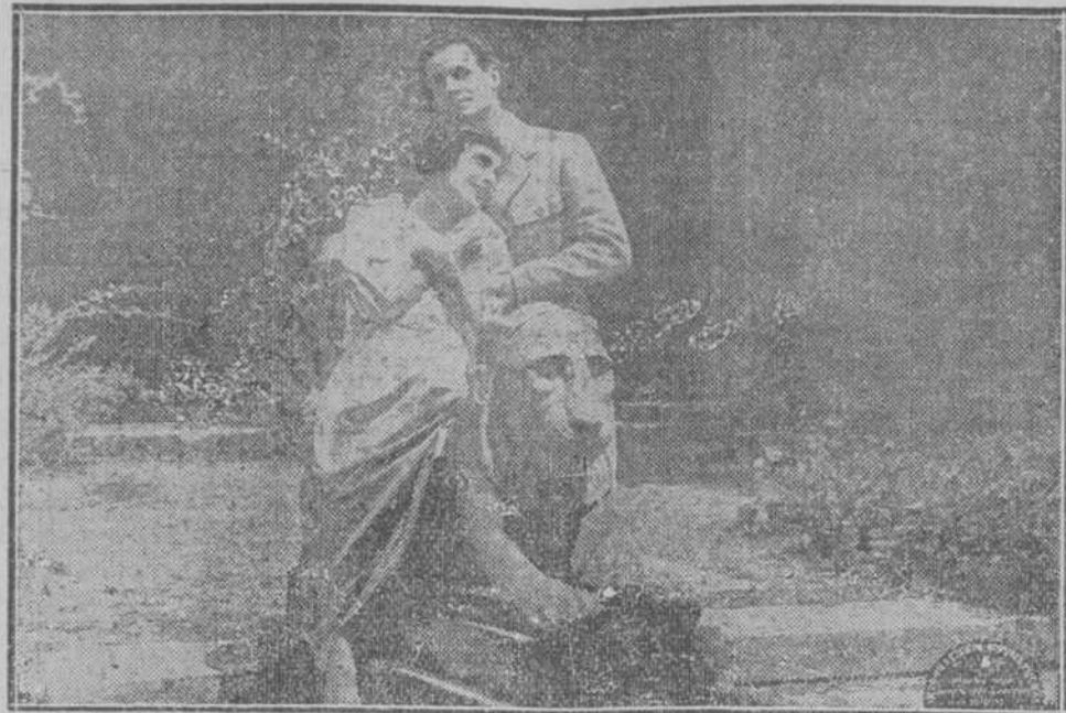
Y aquellas dos almas se comprendieron y empezaron a amarse con la ternura que imprime el verdadero cariño.

"Internacional Cinematográfica". - Rivas y Compañía.