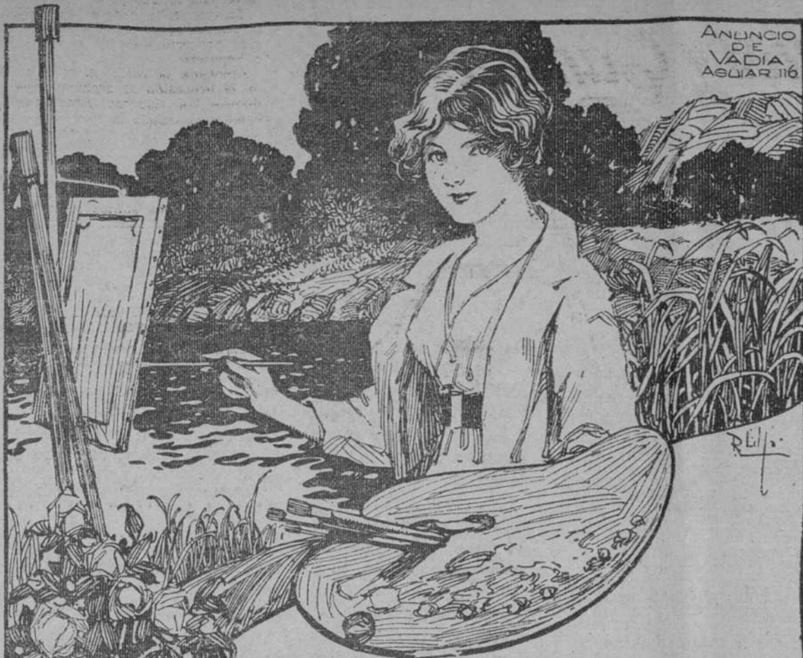
ANUNCIO DE VADIA AGUIAR 116