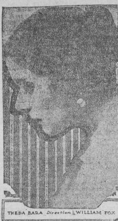
THEDA BARA, Dirección, WILLIAM FOX

MAXIM. —La función de esta noche es de moda. En la primera parte se proyectará la cinta titulada "Gordito Tenorio." En segunda, el hermoso drama "El sordomudo", por Jack Pickford.