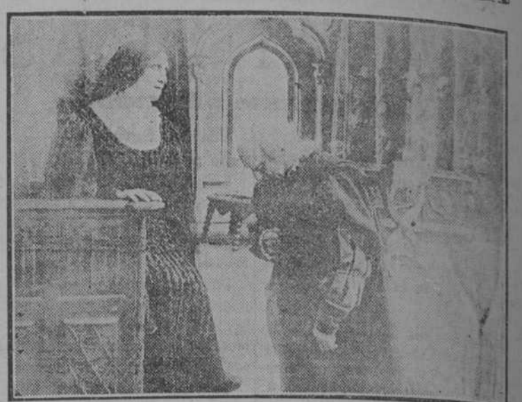
Colón cuenta sus temores a la Reina Isabel. C8550