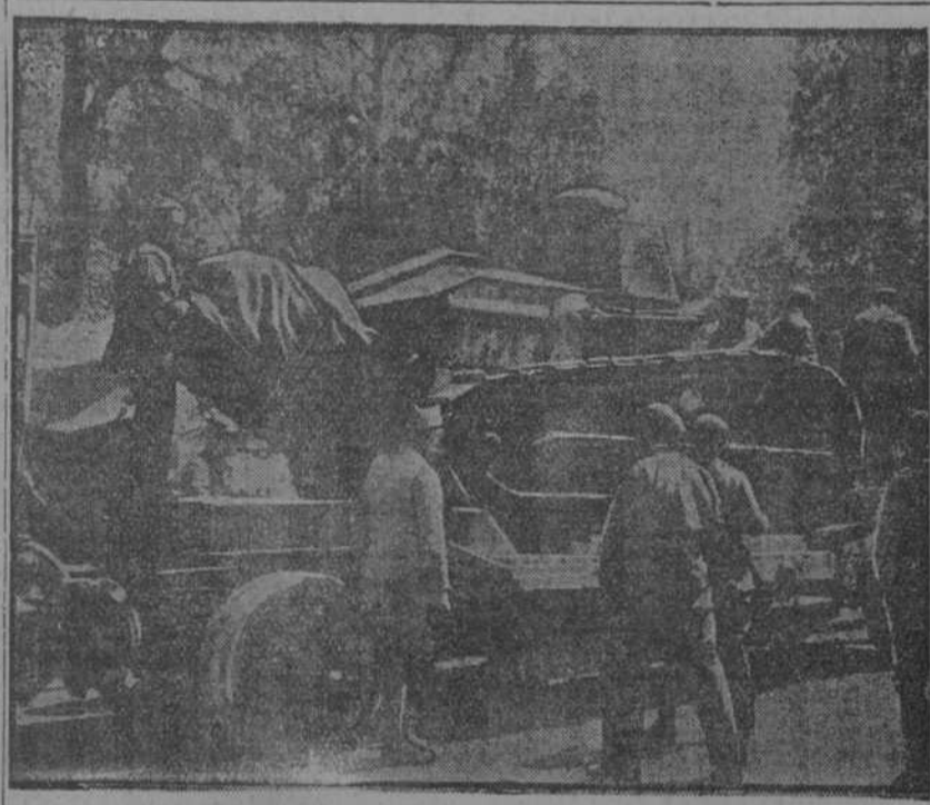
EN EL MARNE.—Cairo de asalto al ser embarrado en un camión.

La ciudad de Alepno fué ocupada por la caballería británica y otras blindadas en la mañana de ayer, dice un parte oficial inglés expedido hoy sobre las operaciones en Siria y Palestina..."