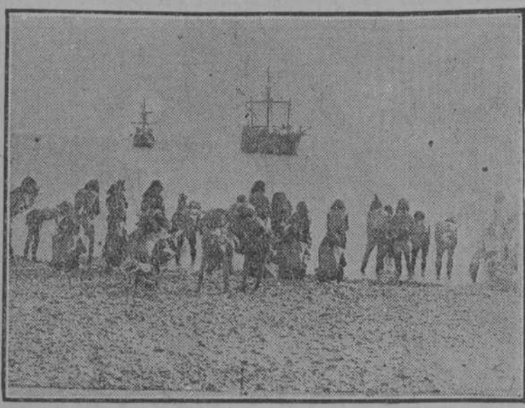
Los naturales del país, presencia asombrados la aparición de las naves expedicionarias.

Esta película pertenece al famoso repertorio de "La Internacional Cinematográfica"