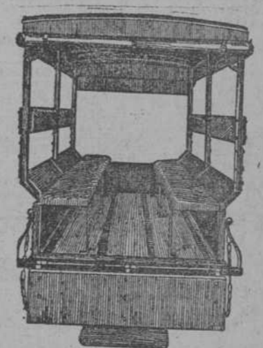
505 Combinación de Guagua y carro de reparto.