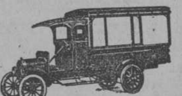
504 Tipo Expreso con techo