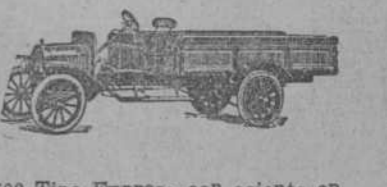
502 Tipo Expreso con asiento en escaquele