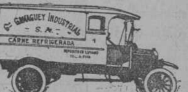
Tipo Refrigerador para carne.