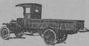
500 Tipo Expreso con caseta