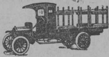
511 Plataforma con estacas móviles

Unicos de 1 y media y 2 y media Toneladas