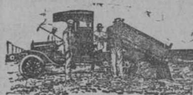
Tipo de Volvo. 1 metro cúbico o 1 1/2 To. Capaz.