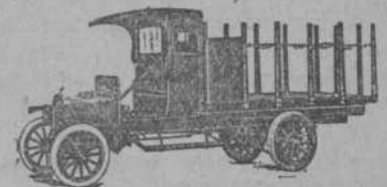
502 Tipo plataforma con estacas móviles.