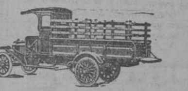
504 Tipo Expreso con estacas móviles.