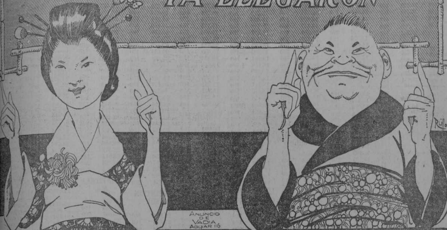
ANUNCIO DE VIAJE AGUIAR 10

CIGARROS EXQUISITOS, PAPEL JAPONES ARROZ Y ROSA YA LLEGARON