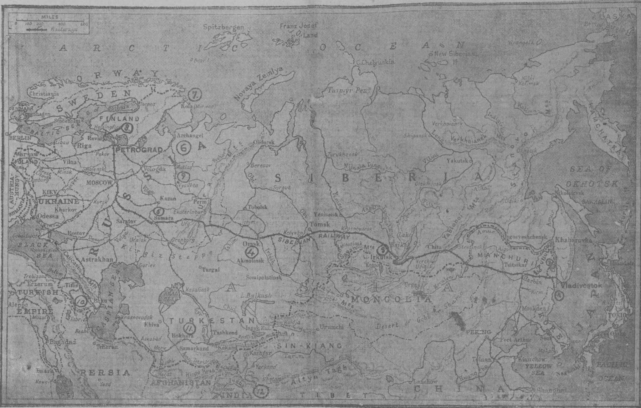
1. Vladivostok.—2 Río Ussuri.—3 Irkutsk sobre el lago Baikal.—4 Omsk capital del Estado de Siberia.—5 Samara donde se halla un grupo de Cesco-Eslavos.—6 Arkangel.—7 Murmansk.—8 La faja de Krenstad y su fortaleza.—9 Vika de donde se salvó al Czar para ser fusilado.—10 Bakú.—11 Turkestán.—12 India.

NO SIEMPRE FUE RUSIA MOTIVO DE PREOCUPACION, SINO DE GRAN ALIENTO, PARA LOS ALIADOS.—LA FORMACION DE UNA NUEVA RUSIA DESDE VLADIVOSTOK AL LAGO BAIKAL.—LA ZONA BOLSHEVİK DEL TRANSIBERIANO.—LA ZONA CENTRAL DE LOS CESCO-ESLAVOS DESDE VIATKA HASTA EL DON.—SITIO DONDE FUSILARON LOS SOVIET DEL URAL AL CZAR.—EL MOURMANSK Y ARKANGEL, CENTRO DE FUERZAS ALIADAS.—EL CAUCASO Y EL TURKISTAN DEFENDIDOS POR INGLATERRA.