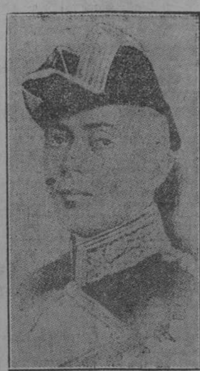
Almirante Paul von Hintze, Ministro de Estado de Alemania.