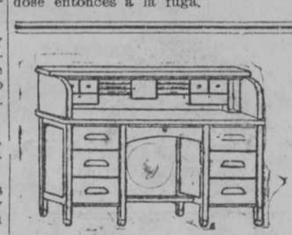
Metas Advertising Agency, Inc.