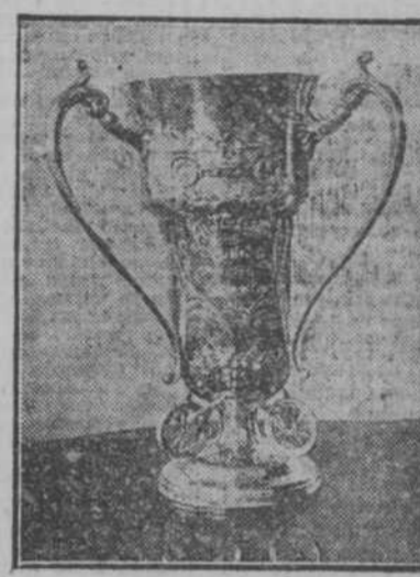
Copa donada por el Auto Club de Cuba.