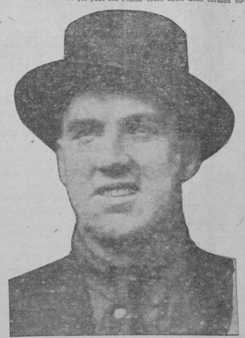
JESS WILLARD, CAMPEON MUNDIAL DE BOXEO.

discutir el título. Además, podía con todo derecho exigir a Willard que antes de "pelear" conmigo lo hiciera con otros muchos que ya habían sido derrotados por mí. "Pero me dolían los oídos de oír hablar de la "esperanza blanca". No trascurriría una semana sin que alguien anunciara que el trono de Rey de la Fuerza se tambaleaba en mis manos! "Además, mi mujer estaba ansiosa de verme ganar una vez más aplausos y honores. Lucía más que nadie ansiaba aquella pelea, lejos, muy lejos de sospechar que pudiera ser mi Waterloo. "Yo creo firmemente que pude ac-