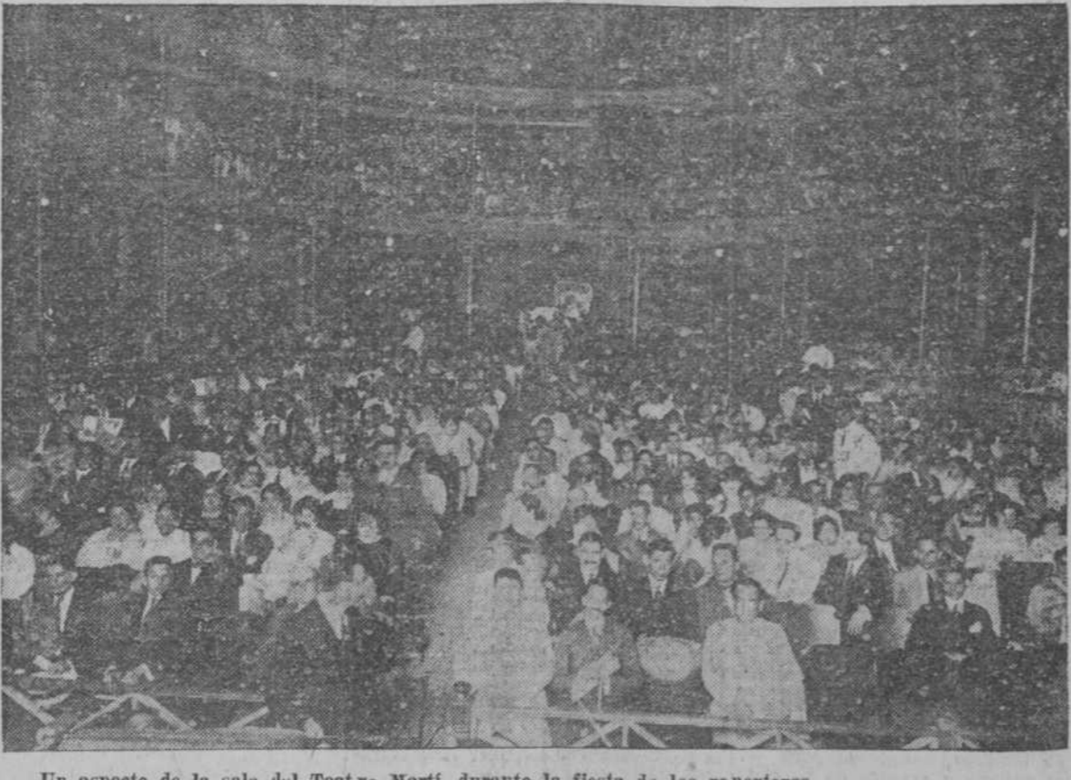
Un aspecto de la sala del Teatro Martí, durante la fiesta de los reporteros.