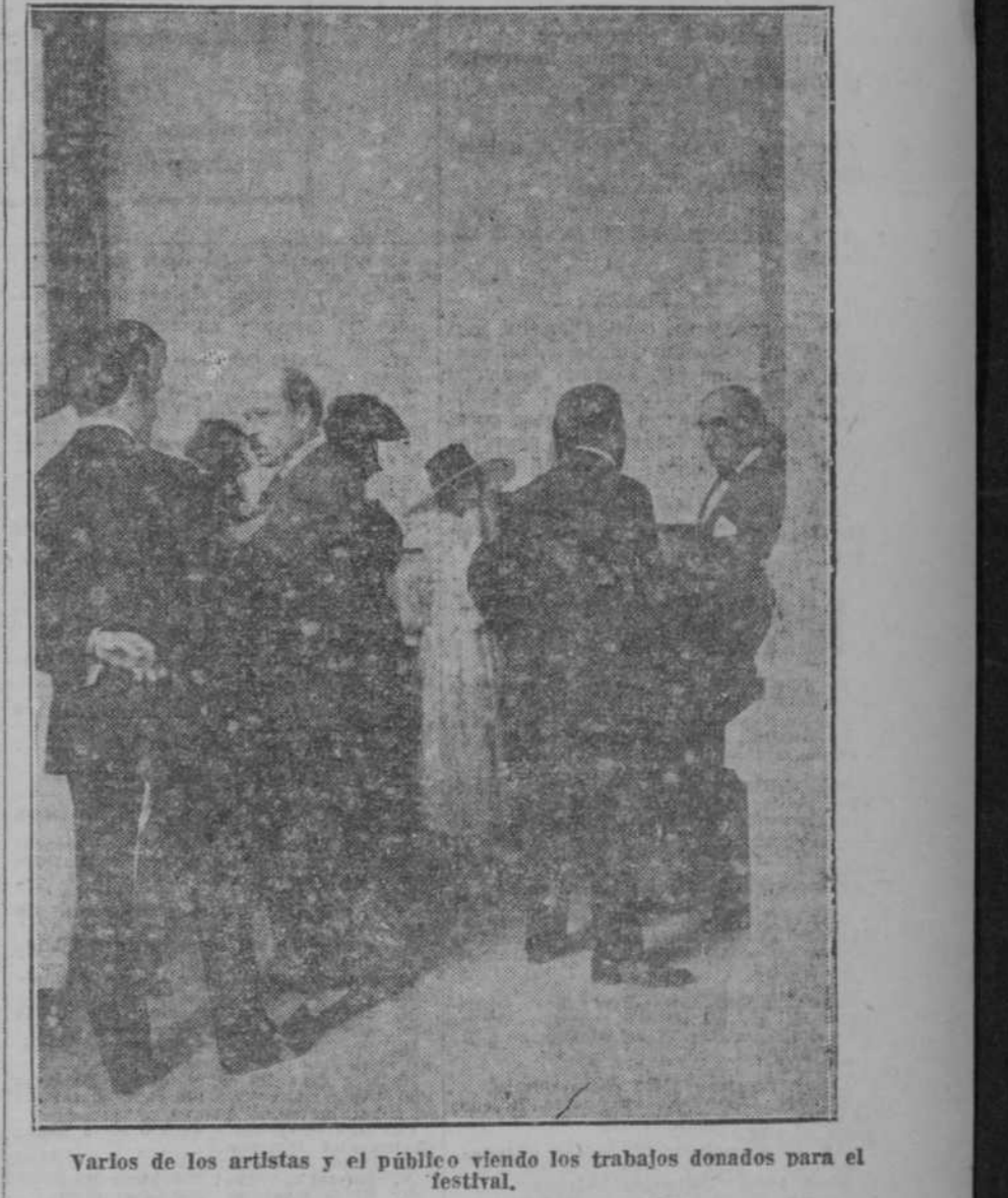
Varios de los artistas y el público viendo los trabajos donados para el festival.