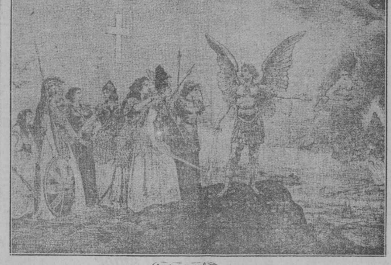
Famoso dibujo ejecutado por Herman Knachiuss bajo la dirección del Kaiser. La nube incendiada con el Buda de Kamakura en el centro se adelanta sobre un valle en que existen iglesias cristianas. Las naciones de Europa sobre una altura se aprestan a defenderse. El Kaiser escribió debajo de su puño y letra, firmándolas, estas palabras: "Pueblos de Europa defended vuestras más sagradas propiedades."

ESE TEMOR DEL KAISER NO FUE DEL TODO REAL SINO MEDIO PARA CONSTRUIR LA ESCUADRA ALEMANA.—LA LUCHA ENTRE LA RAZA BLANCA Y LA MONGOLICA.— FEDERICO II, BARBAROJA Y LA INVASION MONGOLICA DEL IMPERIO ALEMAN