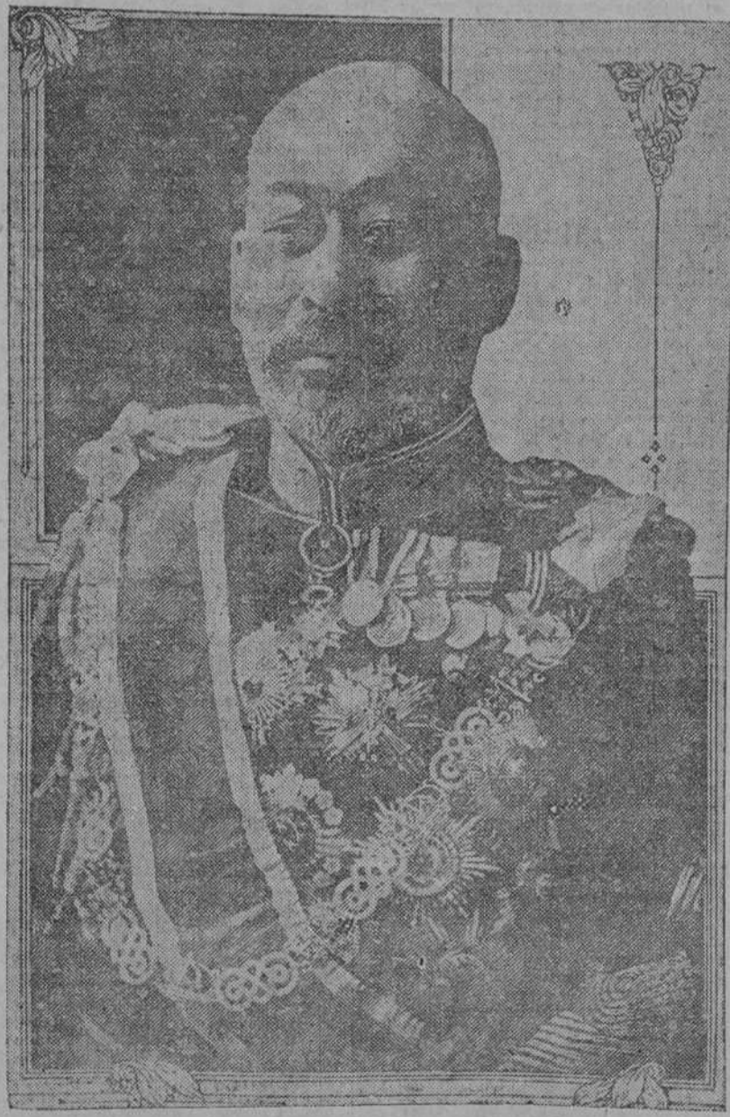
CONDE T. ERAUCHI, Presidente del Gobierno japonés

Crean todos, añadió, que la condición de vida del pueblo bajo la anarquía Bolshéviki es tal, que ya es intolerable y que a falta de la intervención japonesa sola o apoyada por los Estados Unidos o los aliados, darían la bienvenida a cualquiera que pudiese orden, hasta a los mismos alemanes. Ningún ruso se ofenderá, por lo tanto, porque intervenga el Japon.