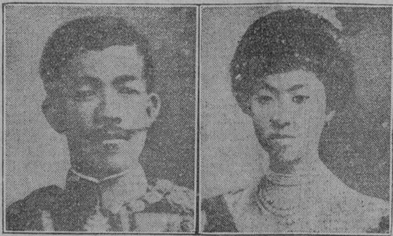
EL EMPERADOR Y LA EMPERATRIZ DEL JAPON