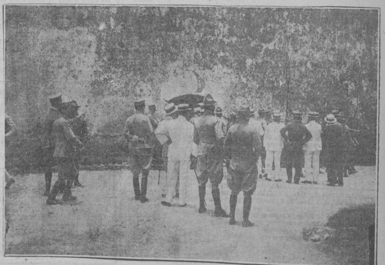
LOS OFICIALES ACUSADOS, SALIENDO DEL CONSEJO DE GUERRA, CUSTODIADOS POR LOS CADETES DE LA CABASA