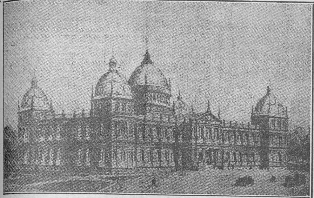
PROYECTO DEL PALACIO DE LA UNIVERSIDAD QUE SE VA A LEVANTAR EN SEVILLA.